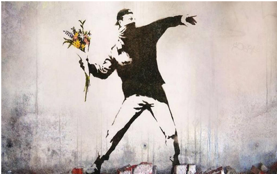
Œuvre de Banksy, 2019